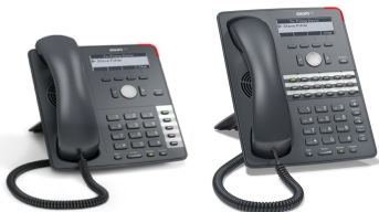
Telefoni S-710 e S-720